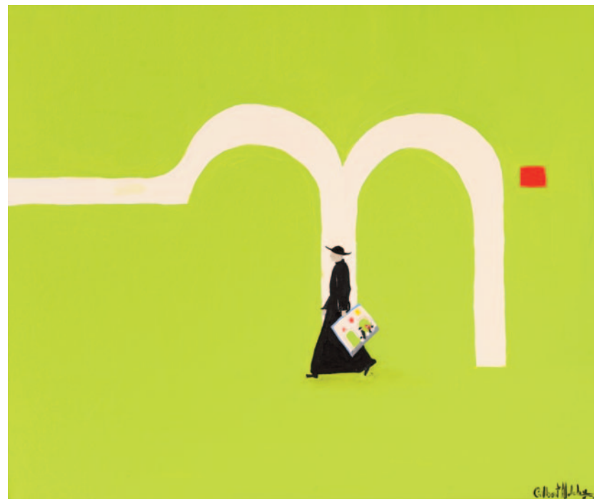
L'abito non fa il monaco, 2023 olio su tela applicata su cartoncino 50 x 60 cm