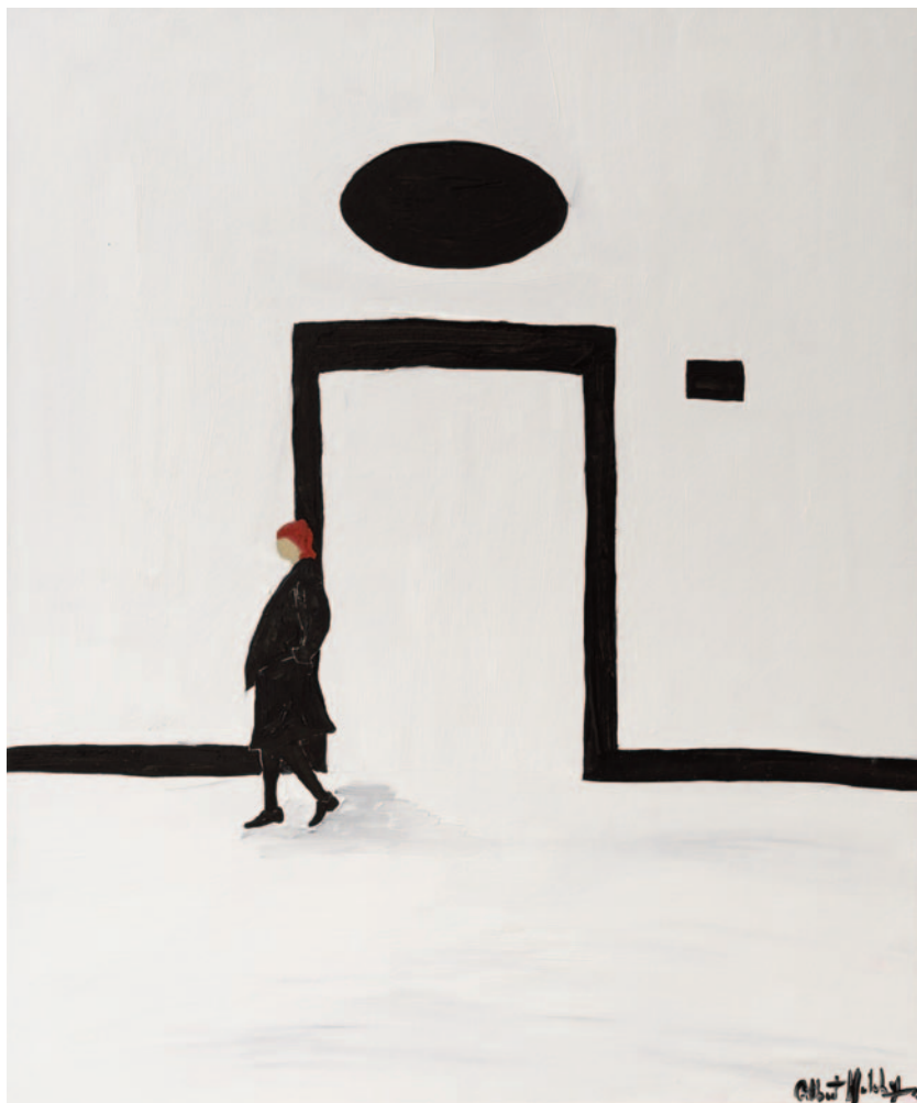
Isabella II, 2023 olio su tela applicata su cartoncino 60 x 50 cm