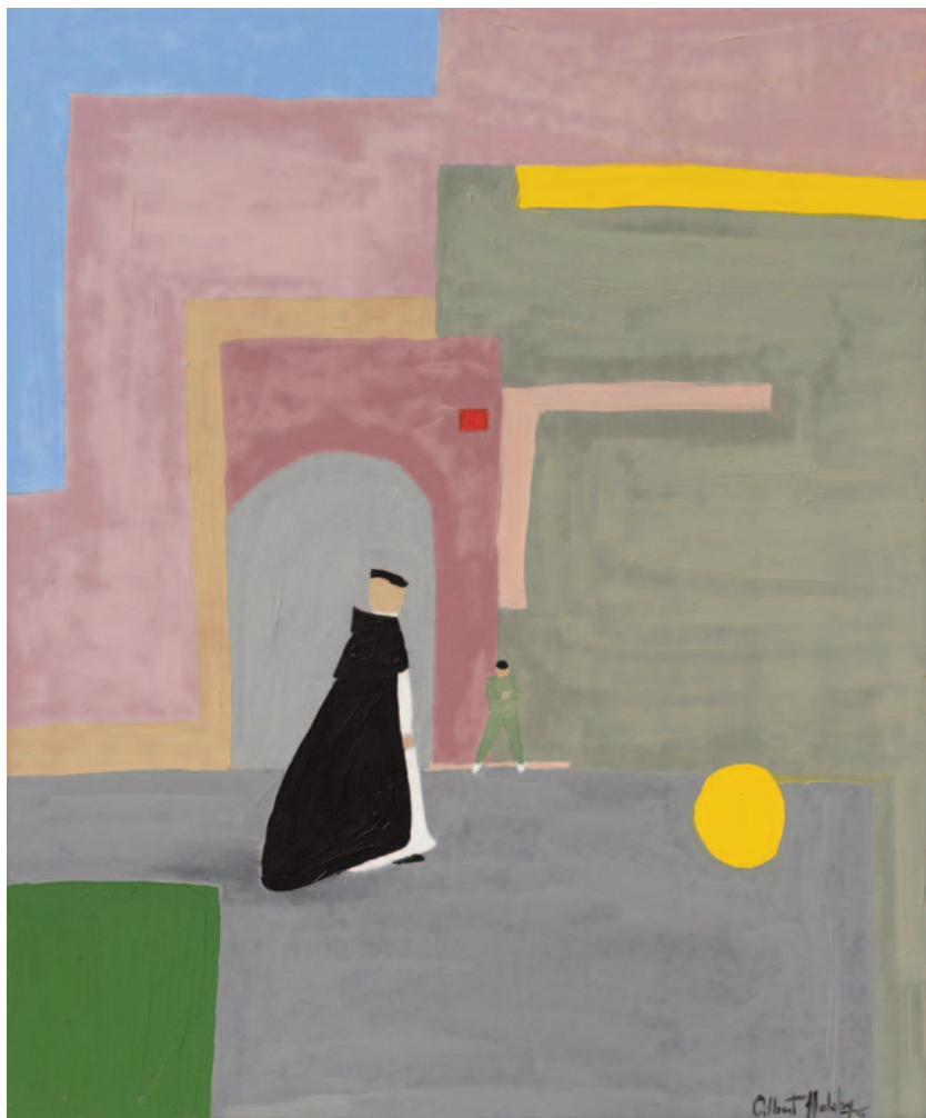
"He Knows", 2022 olio su tela applicata su cartoncino 60 x 50 cm