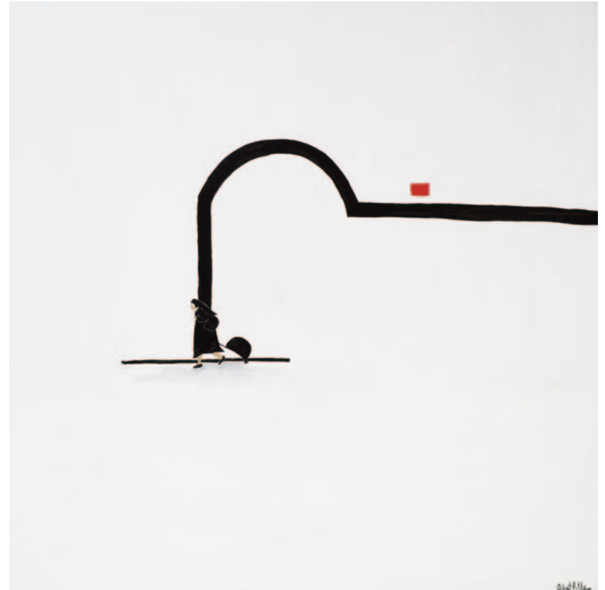
Entr'acte , 2023 olio su tela 100 x 100 cm