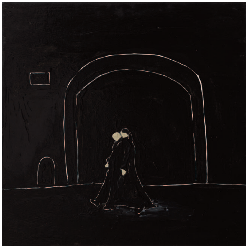
Confessions, 2023 olio su tela applicata su cartoncino 30 x 30 cm