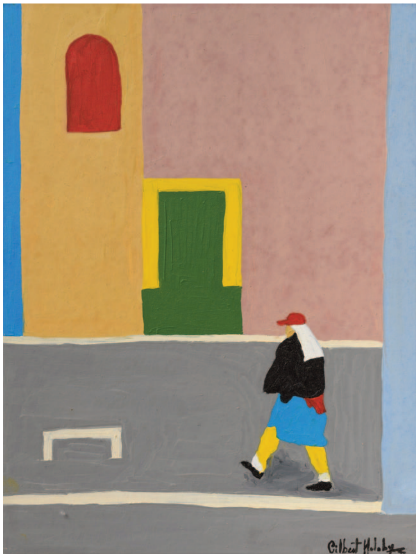
Il saggio a Piazza Navona, 2023 olio su tela applicata su cartoncino 40 x 30 cm