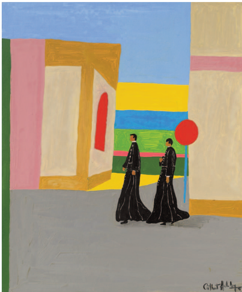
Visitors, 2022 olio su tela applicata su cartoncino 60 x 50 cm