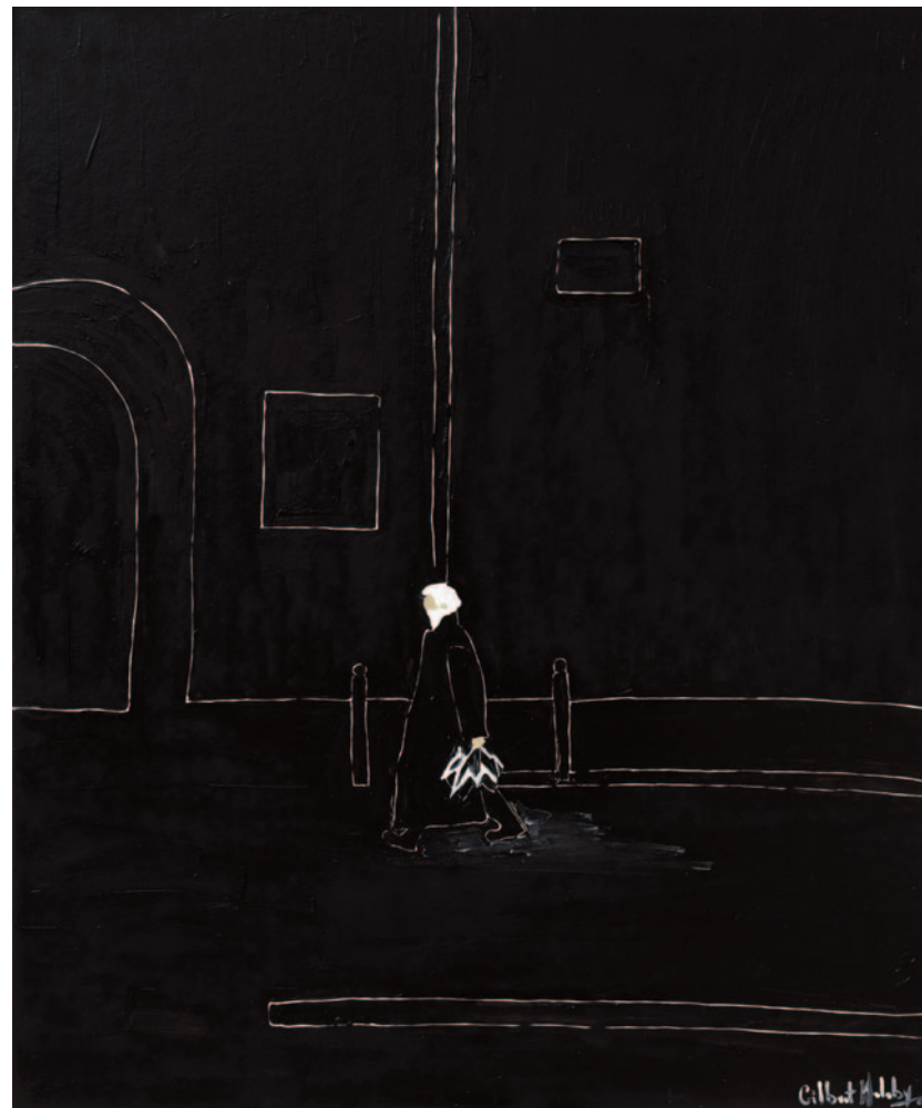
Philosophizing Under The Rain, 2023 olio su tela applicata su cartoncino 60 x 50 cm