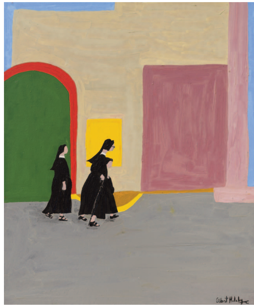
The Promenade, 2022 olio su tela applicata su cartoncino 60 x 50 cm