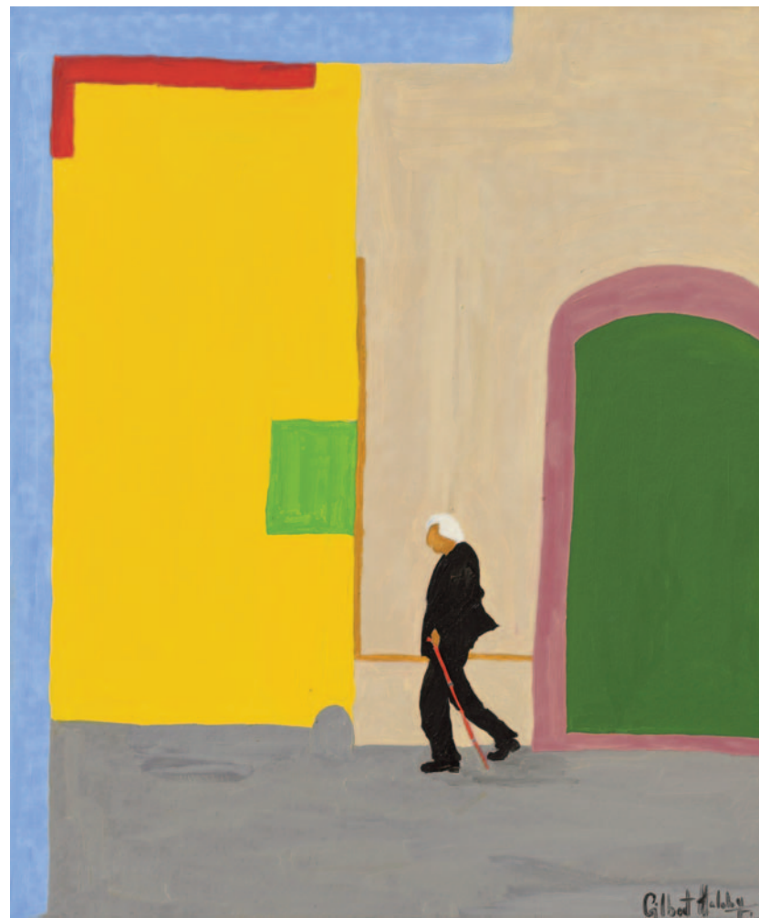
Ce la farò, 2022 olio su tela applicata su cartoncino 60 x 50 cm