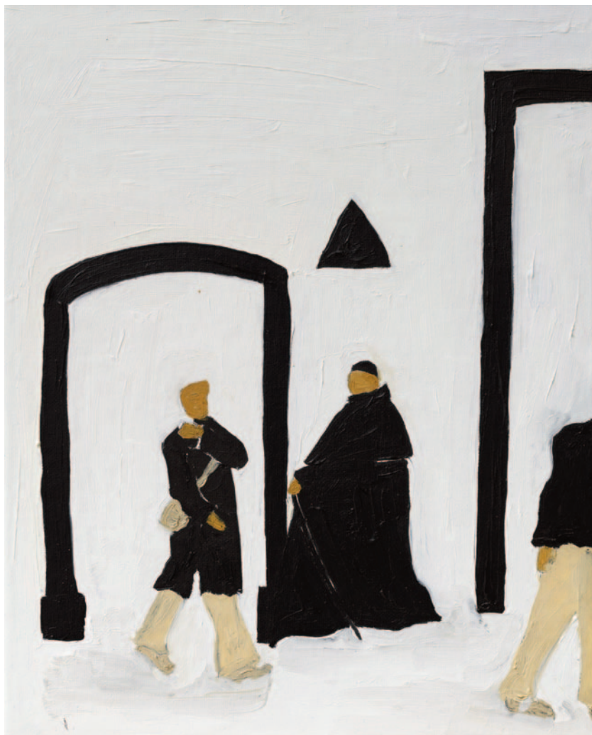
Via del Pellegrino, 2023 olio su tela applicata su cartoncino 25 x 20 cm