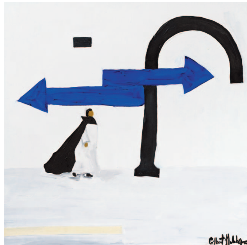
Heaven Or Hell, 2023 olio su tela applicata su cartoncino 40 x 40 cm