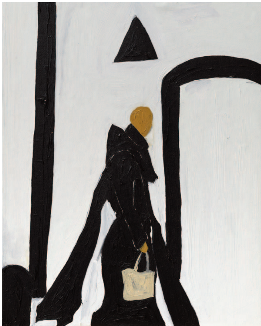
Ti ho beccato da vicino , 2023 olio su tela applicata su cartoncino 25 x 20 cm