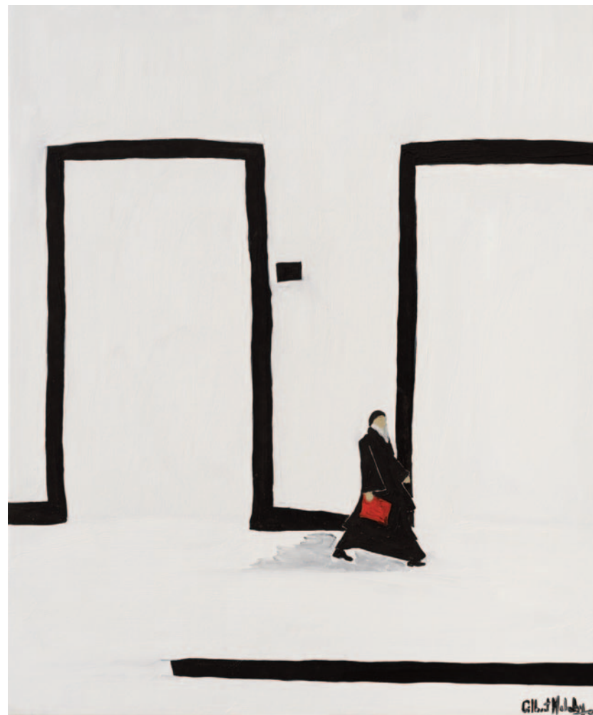
Towards The Hellenism, 2023 olio su tela applicata su cartoncino 60 x 50 cm