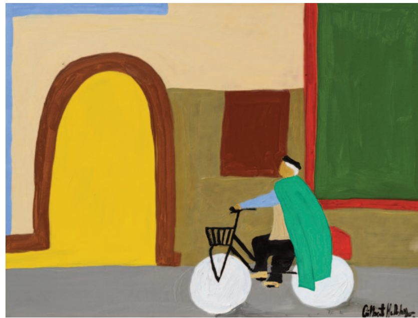
Soraya , 2023 olio su tela applicata su cartoncino 30 x 40 cm