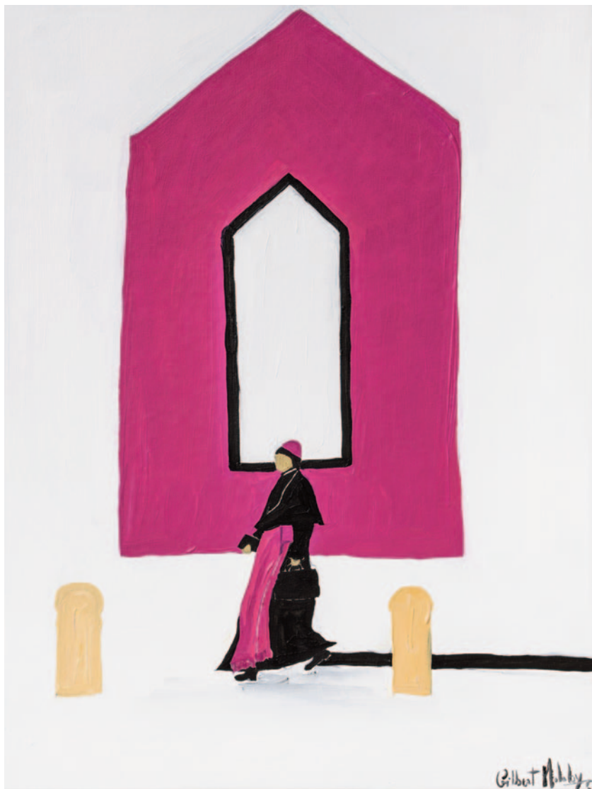
Fuchsia At Last , 2023 olio su tela applicata su cartoncino 40 x 30 cm