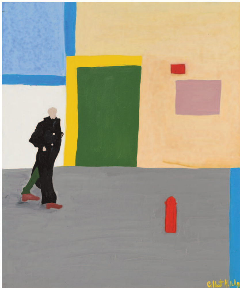
Enzo, 2022 olio su tela applicata su cartoncino 60 x 50 cm