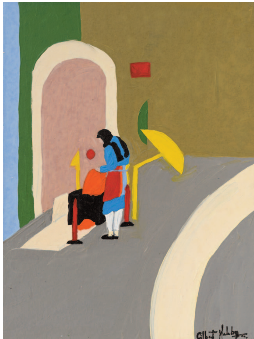
Il saggio al Pantheon, 2023 olio su tela applicata su cartoncino 40 x 30 cm