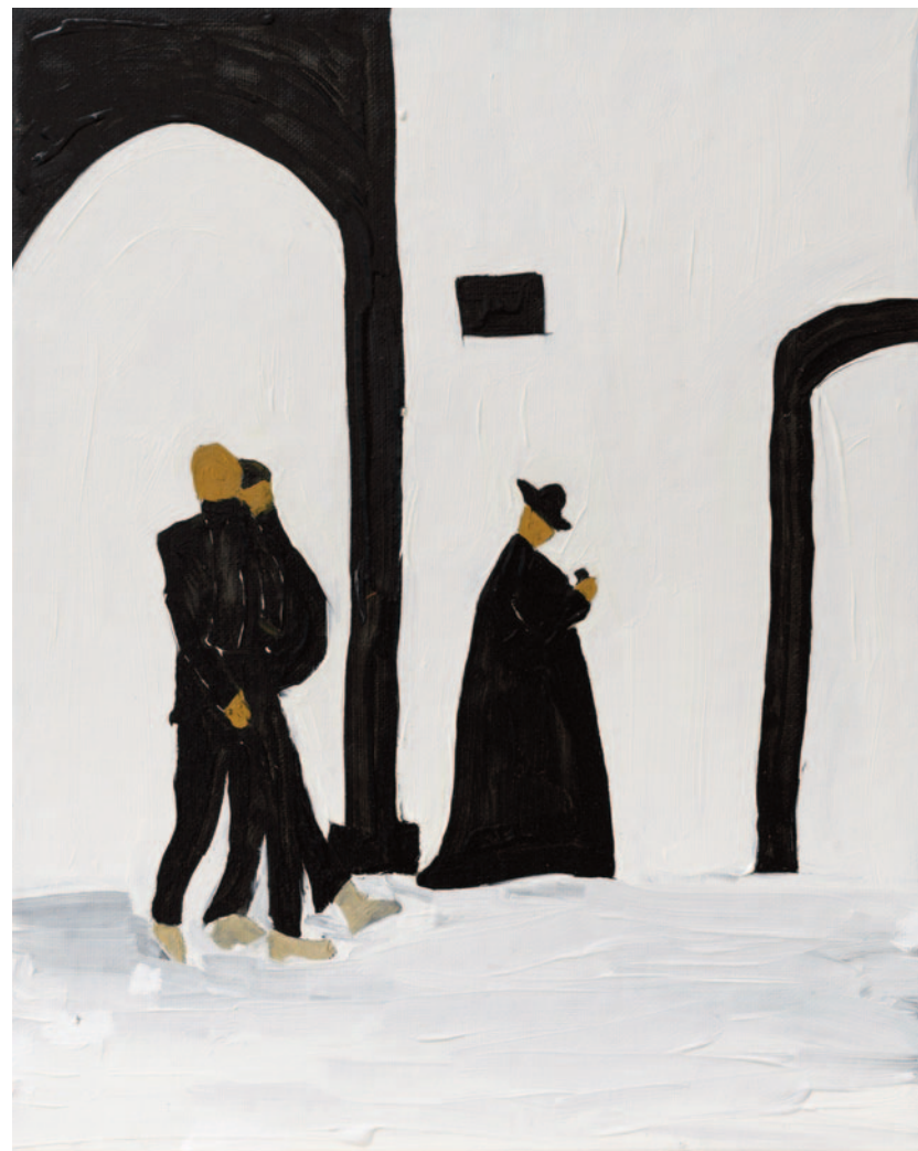
After A Heavy Lunch At Pierluigi, 2023 olio su tela applicata su cartoncino 25 x 20 cm