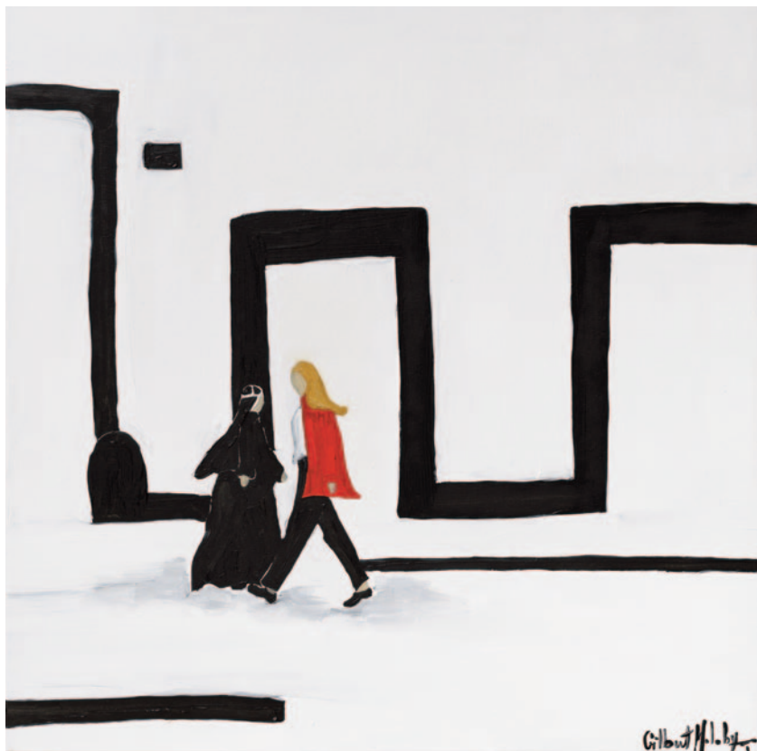
La gallerista, 2023 olio su tela applicata su cartoncino 40 x 40 cm