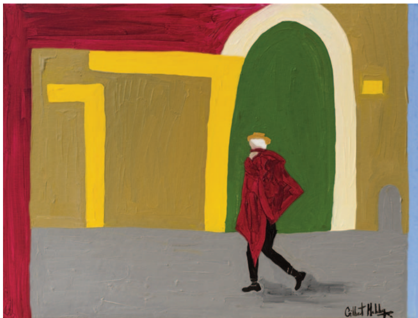
Inés , 2023 olio su tela applicata su cartoncino 30 x 40 cm