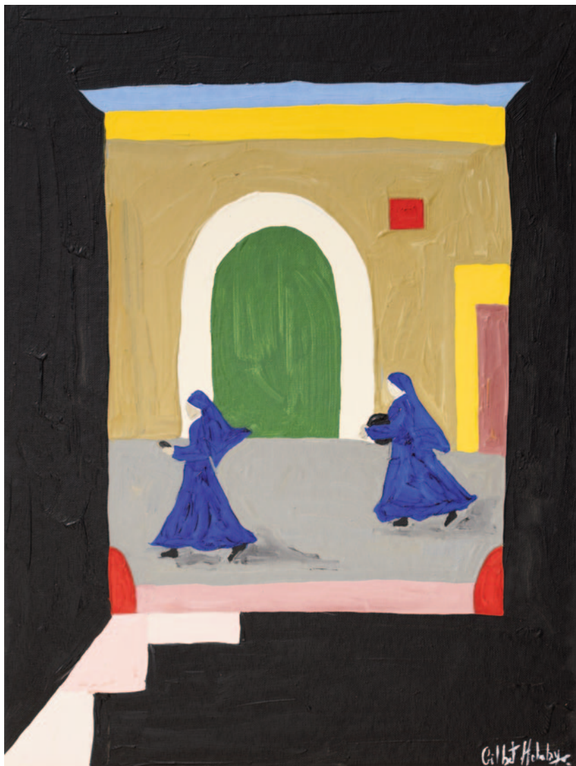
La' fuori, 2023 olio su tela applicata su cartoncino 40 x 30 cm

I am aware that the only certainty in this existence is change, so let me give you another piece of advice this time again, my dearest boy; even if you treasure the past and its glories, accept the changes graciously and enjoy the metamorphosis of cultures and civilisations. Be constantly curious as to what heights humans can climb and to what depths of despair they can plummet.