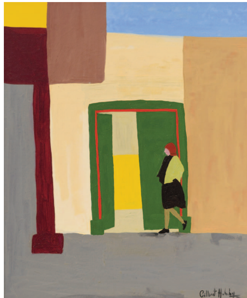
Isabella I, 2022 olio su tela applicata su cartoncino 60 x 50 cm