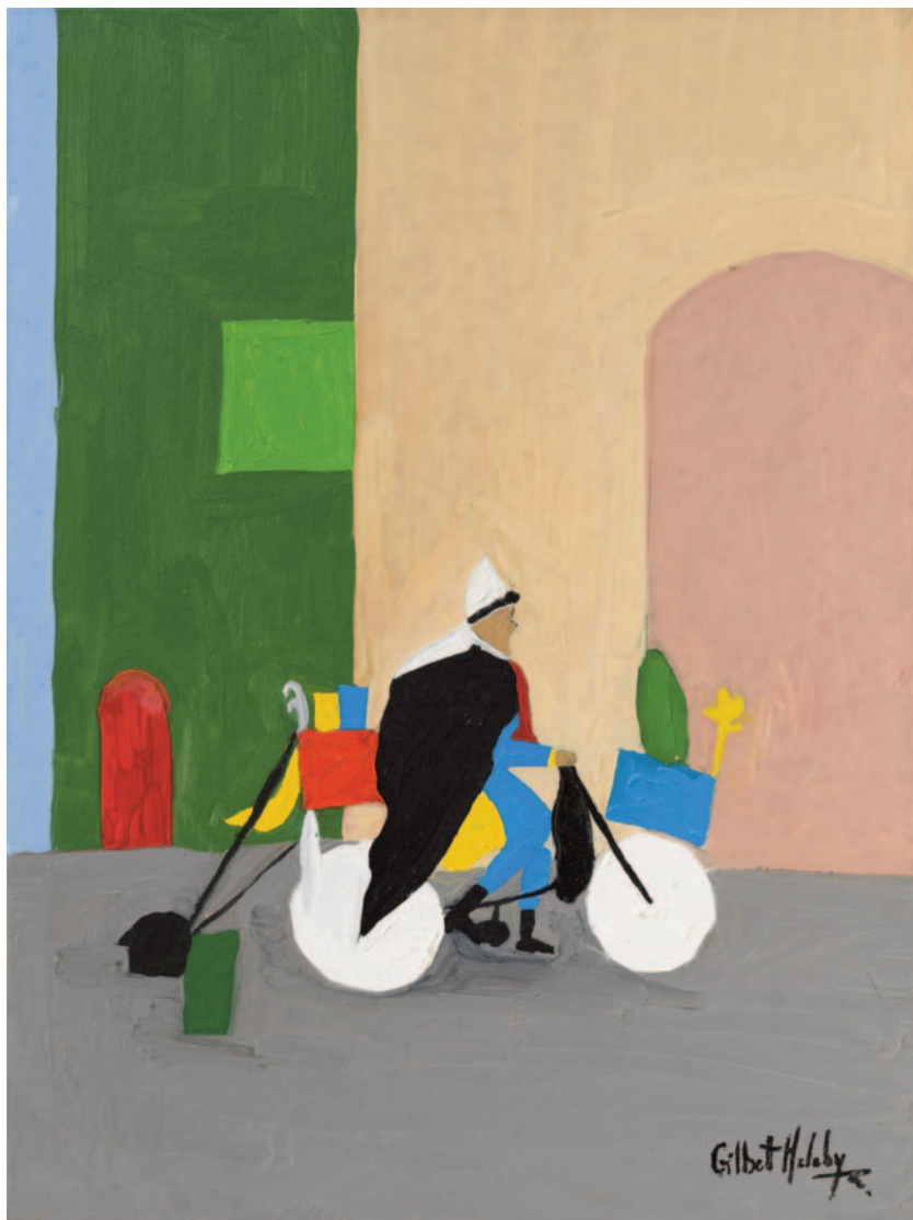
Il saggio a Monserrato, 2023 olio su tela applicata su cartoncino 40 x 30 cm