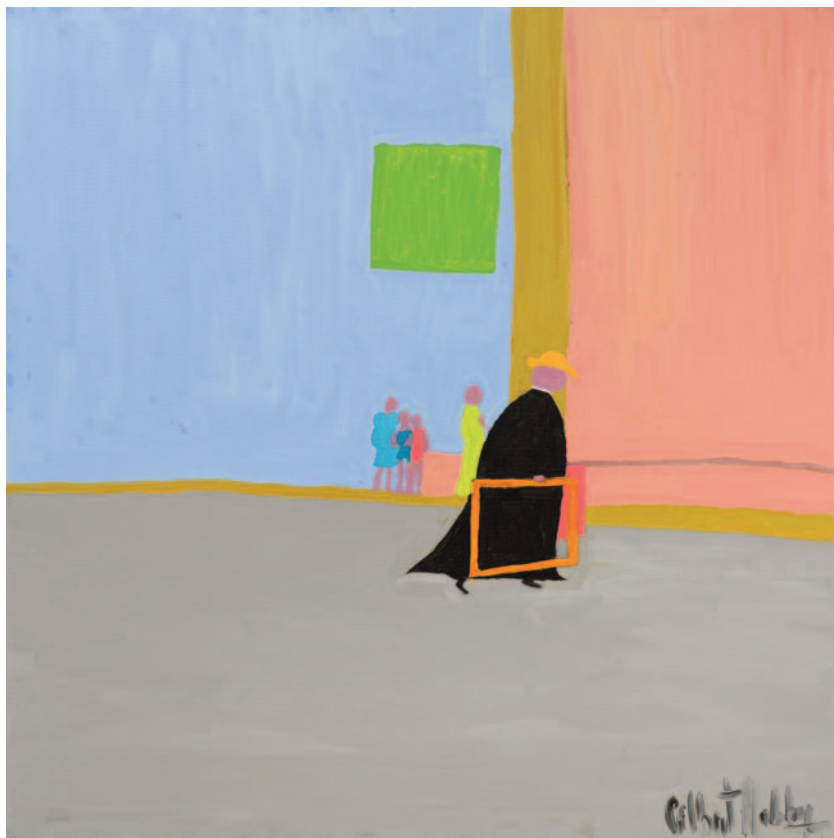
Frame Me! , 2022 olio su tela 100 x 100 cm