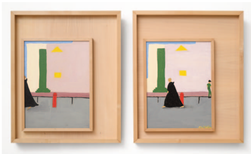
Corinthian , 2023 dittico olio su tela applicata su cartoncino 40 x 30 cm (ciascuno)

mary oil colours. The figures and shapes are created with a single stroke; shadowless, they portray no regret for what is not apparent. Everything is colorful; everything expands on the linen surface lingering between the seen and the imagined. The painting boldly reshapes spaces on the canvas. The blue, red, yellow, pink, black and emerald green are all flawless; they do not make room for nuance, for their power is in their brilliance and youthfulness; they come together and find their purpose within the narrative. The viewer's gaze is welcomed by a happy sight, one that renounces the complexity of details to exalt a fleeting impression of wholeness, an intuition of fullness. Facial features are removed, the character of these dramatis personae emerges through a glance, revealing their basic traits. In turn, the proportions of the bodies appear in space, the rhythm of the steps is captured in its uniqueness, each person has their place in the world, each step its journey.