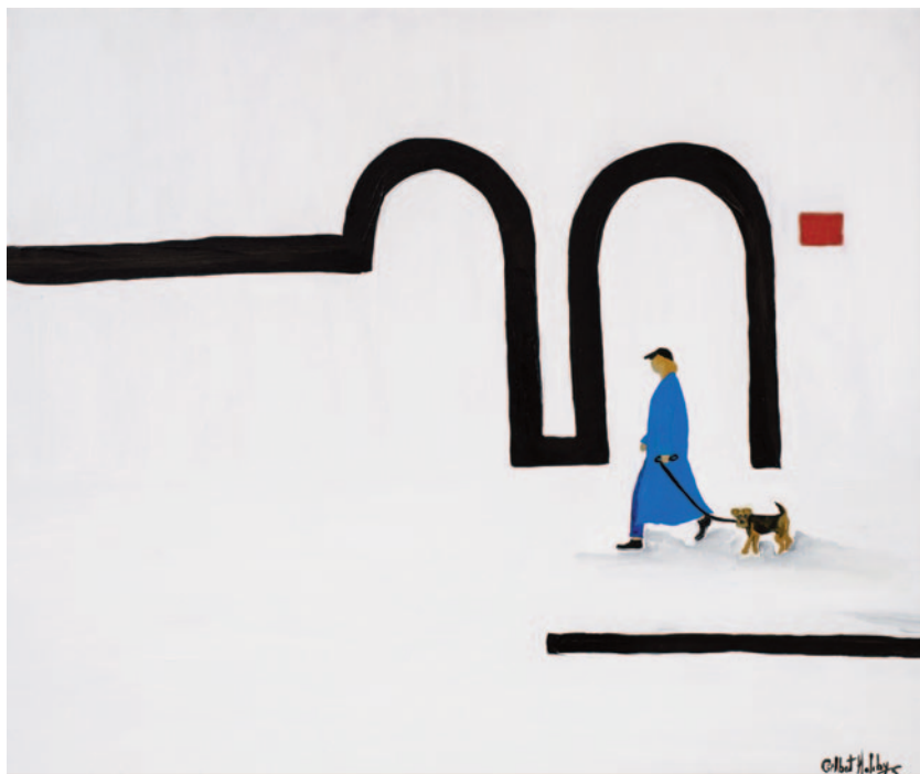
Amare, 2023 olio su tela applicata su cartoncino 50 x 60 cm