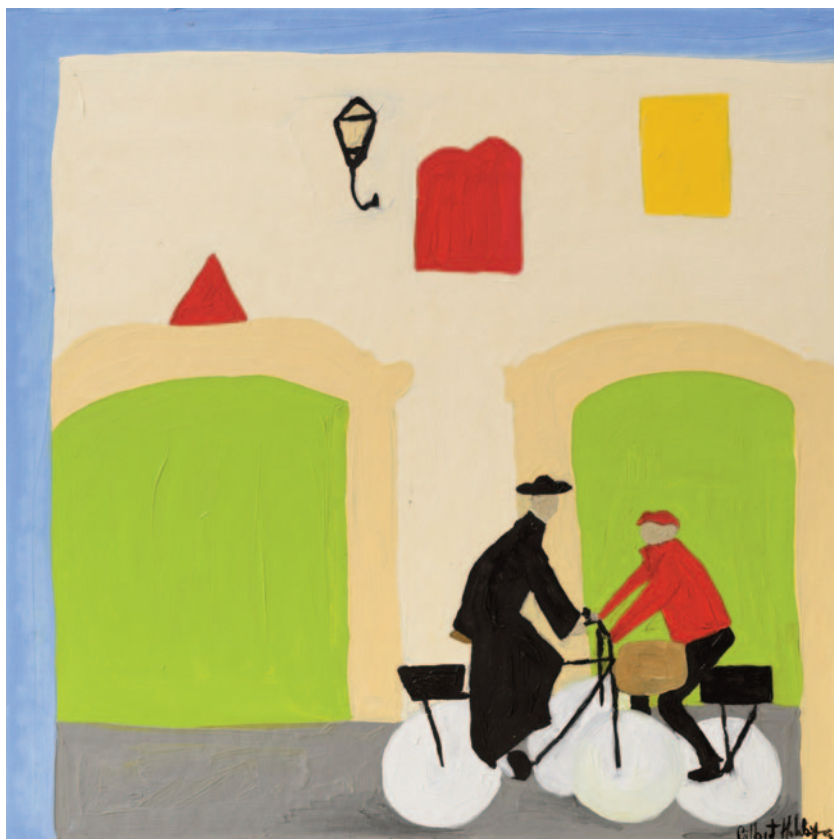
Our Father Browne, 2023 olio su tela applicata su cartoncino 40 x 40 cm

il passare del tempo, intervallando il prima con il poi, lo sfondo architettonico impone allo sguardo una gioiosa asserzione di eterno “hic et nunc”.