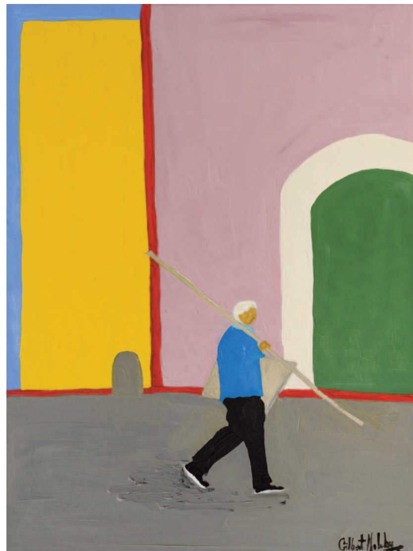
Fra un caffè e l'altro fa il corniciaio, 2023 olio su tela applicata su cartoncino 40 x 30 cm