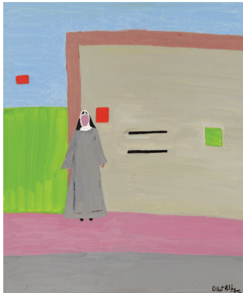
Suor Lucilla, 2022 olio su tela applicata su cartoncino 60 x 50 cm