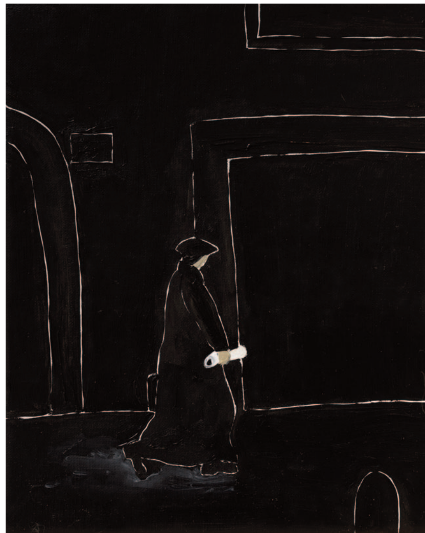
Mi sfuggi sempre , 2023 olio su tela applicata su cartoncino 25 x 20 cm