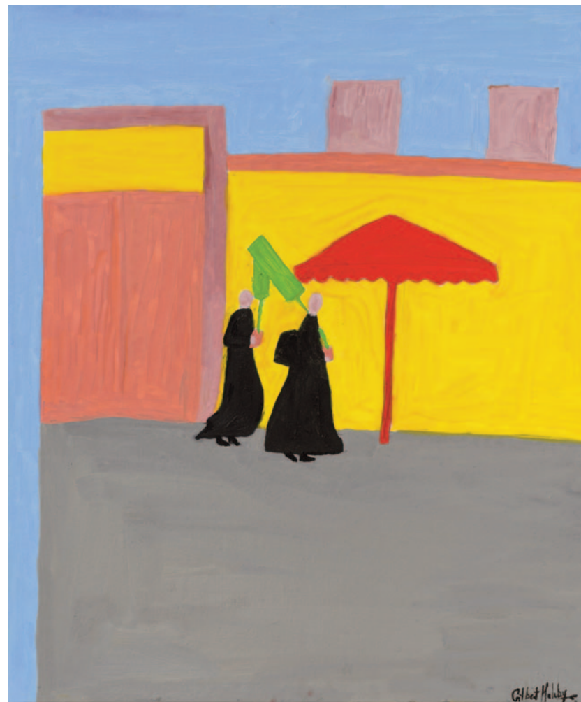
Plant A Tree, 2022 olio su tela applicata su cartoncino 60 x 50 cm